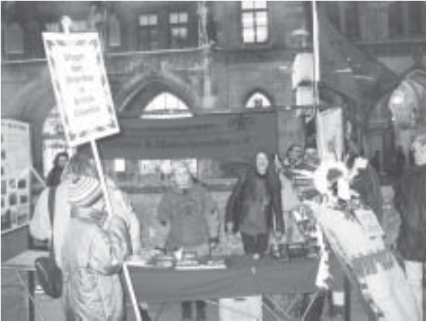
Kundgebung zum Besuch des kanadischen Premierministers