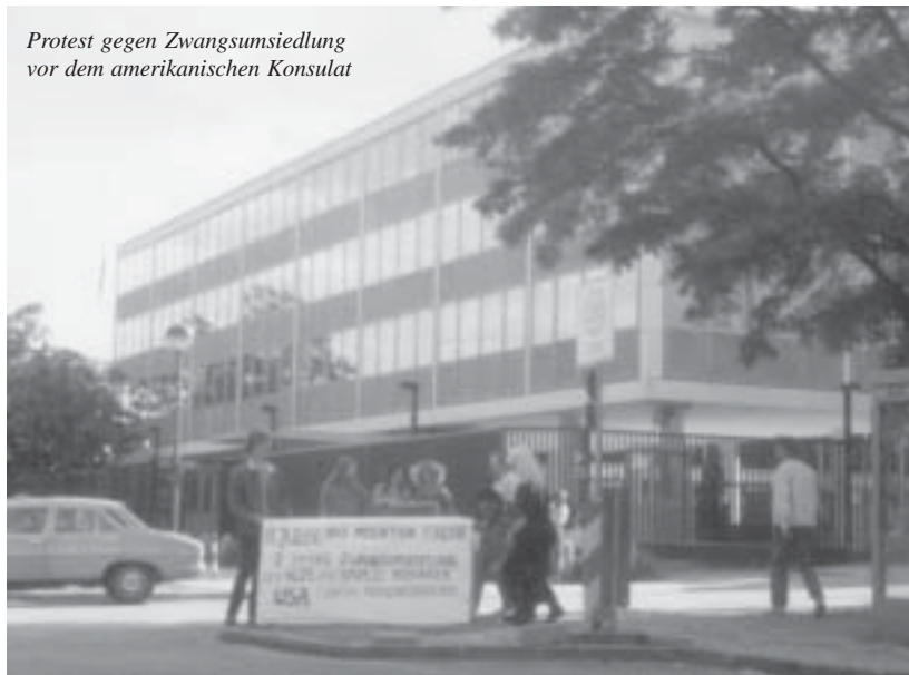
Protest gegen Zwangsumsiedlung vor dem amerikanischen Konsulat