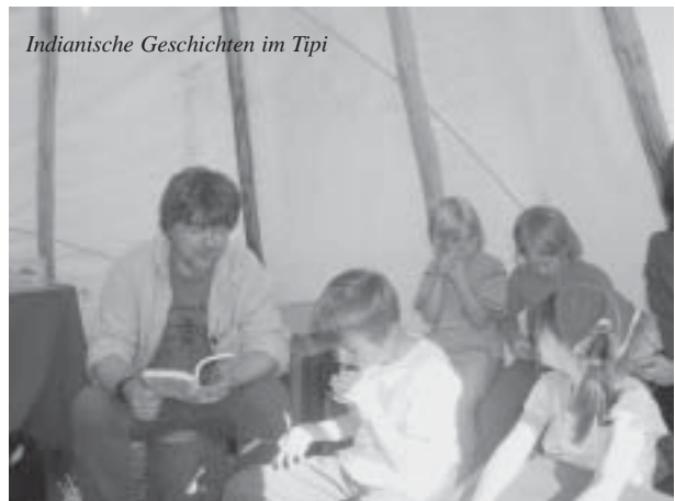
Indianische Geschichten im Tipi