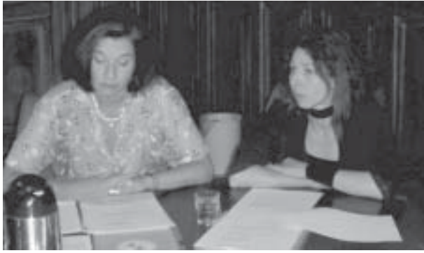
Gemeinsame Lubicon-Eingabe beim Human Rights Committee