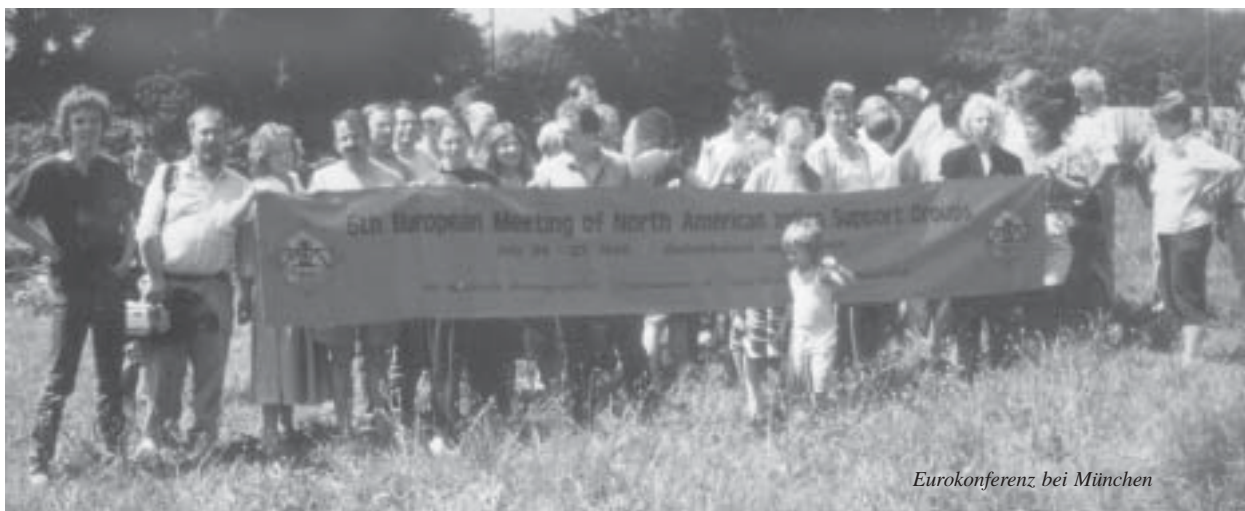
Eurokonferenz bei München