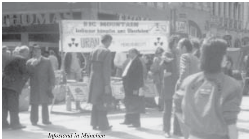
Infostand in München