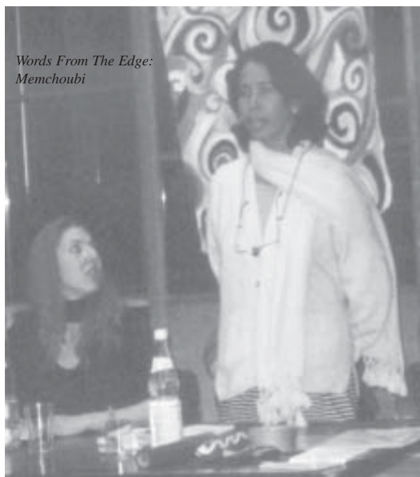
Words From The Edge: Memchoubi