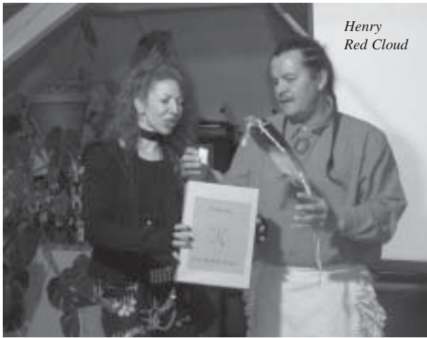
Henry Red Cloud