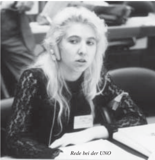
Rede bei der UNO