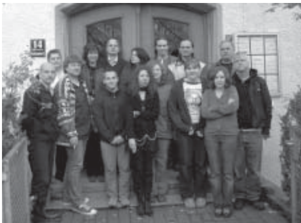
Eurotreffen in München