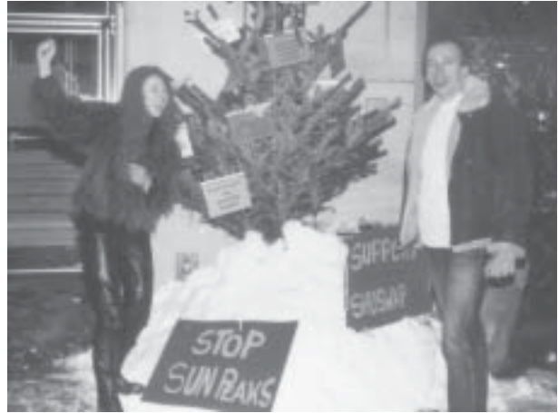
Aktion für die Secwepemc vor dem kanadischen Konsulat