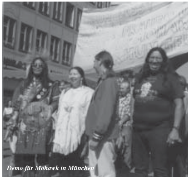
Demo für Mohawk in München